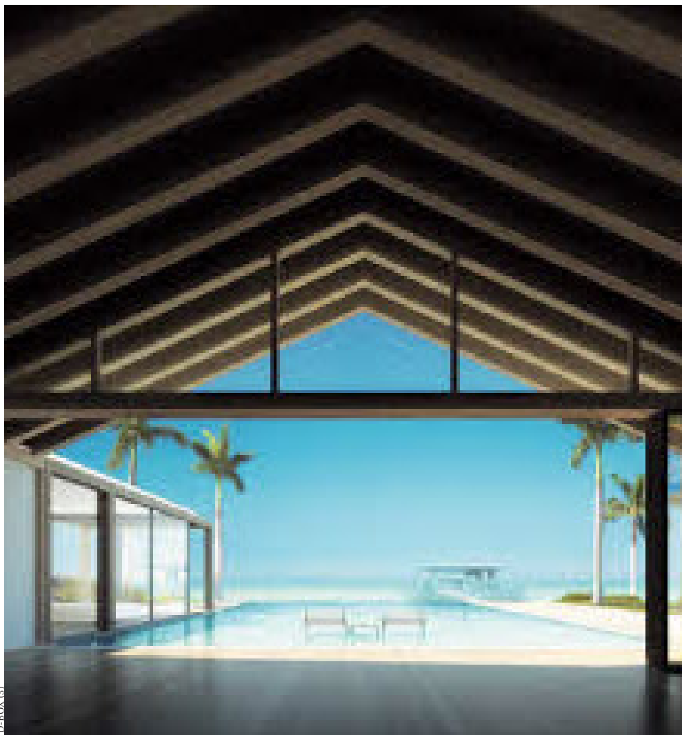
Shigeru Ban entwarf die Strandvillen, er spielt mit japanischem Minimalismus, Licht und Transparenz